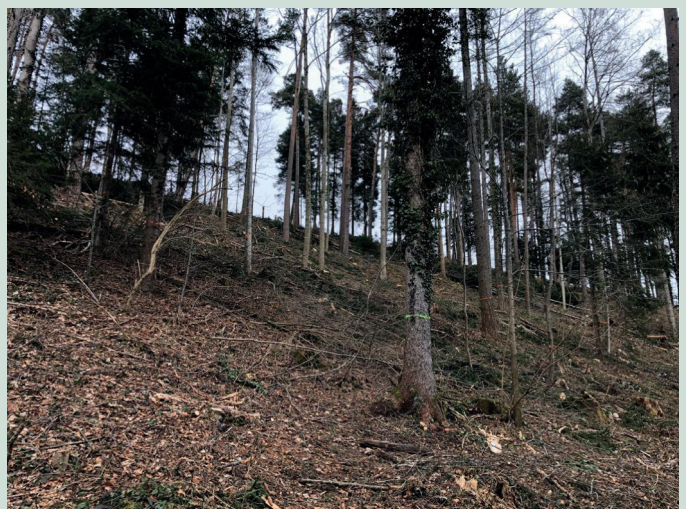
Auslichtung eines Potenzialstandortes, Löffelsberg, 15.01.2025