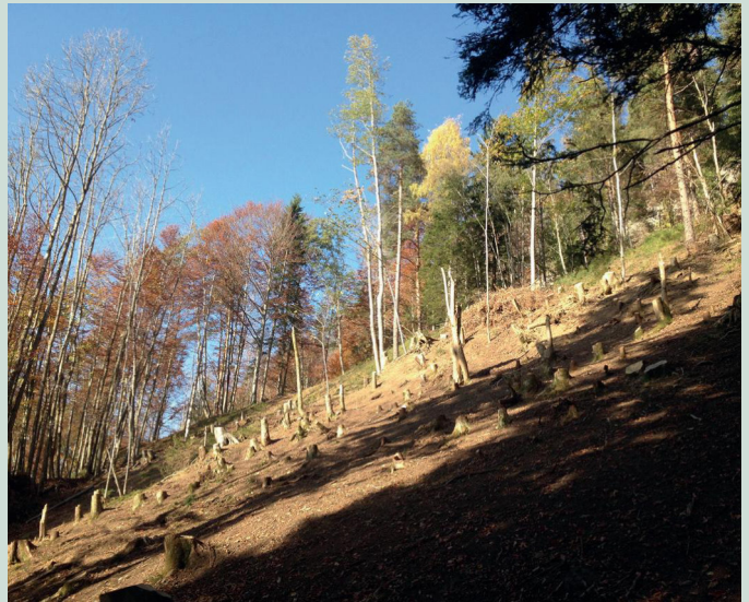
Auslichtung eines Potenzialstandortes, Gelber Felsen, 19.10.2017