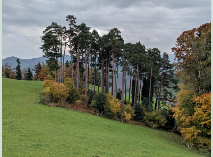
Wiederherstellung Föhrenweidwald, Berlig, 26.10.2021

Waldregion 5 und Landschaftskonzept Neckertal